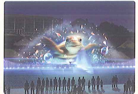
※各写真はイメージです。

音楽に乗って巨大なキャラクターが次々と噴水 上に飛び出す迫力の演出に乞うご期待!